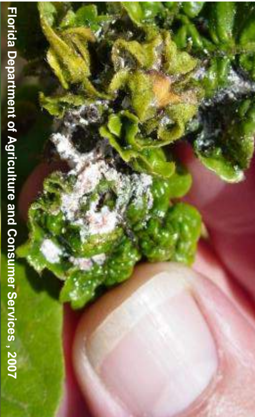
Florida Department of Agriculture and Consumer Services, 2007