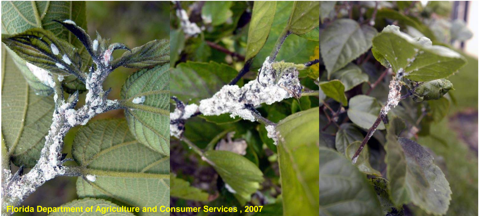
Florida Department of Agriculture and Consumer Services , 2007

Durante el proceso de alimentación M. hirsutus succiona la savia del hospedante, inyectando toxinas que ocasionan malformaciones en las hojas, yemas terminales y frutos. Las especies más tolerantes tienden a infestarse en los puntos de crecimiento y en las axilas del tallo.